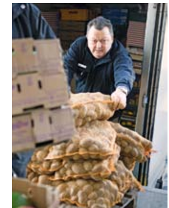
Ein Ehrenamtlicher der Münchner Tafel fährt jeden Mittwoch die Supermärkte und Discounter ab, um Lebensmittel einzusammeln.