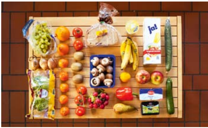
Oben: Obst, Gemüse und andere Lebensmittel, die schnell verderben, erhalten Bedürftige bei den Ausgabestellen der Tafel. Unten: Zwischen 2003 und 2009 hat sich die Zahl der Tafeln in Deutschland verdreifacht. Es gibt sie auch im reichen München.

Auf den ersten Blick sieht es aus wie ein Wochenmarkt: Auf langen Tischen stehen Kisten mit Obst und Gemüse, vor einem Lieferwagen drapiert ein Mann mit blauer Schürze Körbe mit Brot. Doch da ist diese Schlange von Menschen: Rentner in abgetragenen Mänteln, Menschen mit Krücken, Migranten, Frauen mit Kinderwagen, die Köpfe gebeugt, bepackt mit abgewetzten Einkaufstüten aus einer Zeit, als das Geld noch für einen Einkauf im Supermarkt reichte. Zweihundert Bedürftige stehen an dieser Ausgabestelle der Münchner Tafel und warten, bis sie von Ehrenamtlichen die Taschen mit Lebensmitteln gefüllt bekommen. Das Prinzip der Tafeln ist so einfach wie faszinierend: