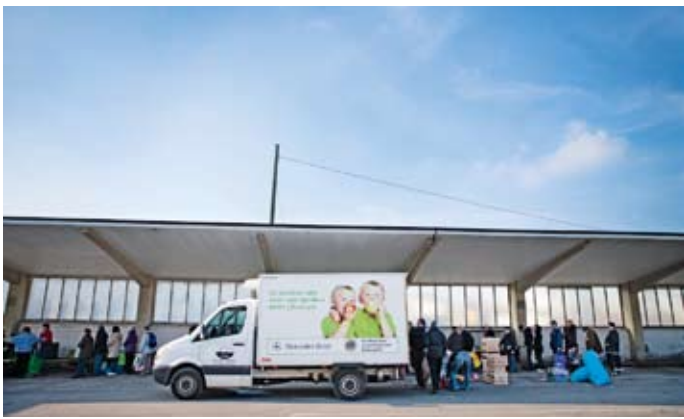
Wer Produkte von den Tafeln will, muss seine Bedürftigkeit nachweisen.