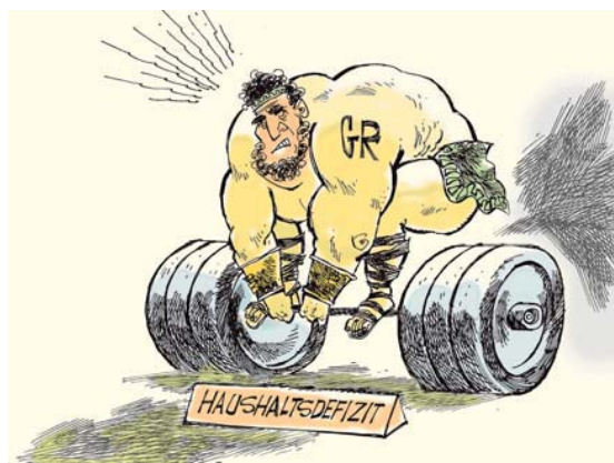
Herkules packt endlich an. JANSSON